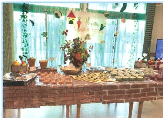
スイーツバイキングの様子