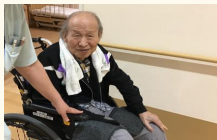
☆ インタビュー中 ☆