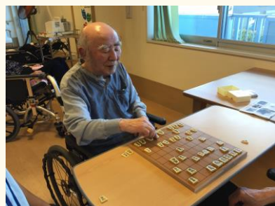
他者と将棋を楽しんでいます♪