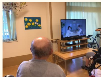
お相撲やサスペンスが大好き☆