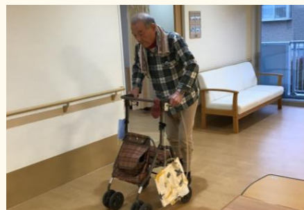
歩行と筋トレの自主訓練は日課 にしてやっています！！