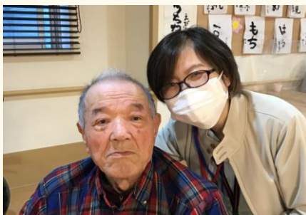
ケアマネさんとパジャリ📷