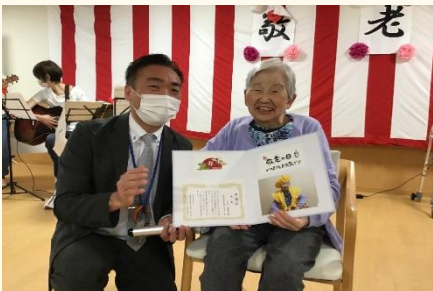
米寿のお祝いをさせて頂きました。 これからもたくさん思い出作りましょう。