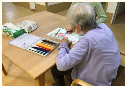
キレイな色使いで 仕上げてください。