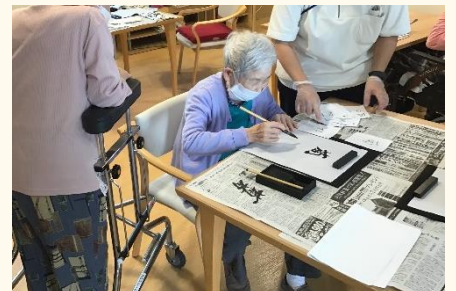
書道にて達筆披露♪