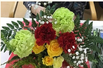
小沼様作: フラワーアレンジメント