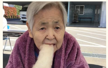
綿あめ美味しそうですね😊