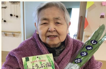
菖蒲湯に入ります！