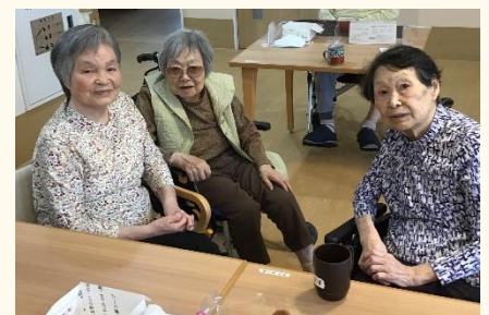
仲良しの方がと談笑中♪