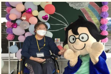
船えもんと一緒に！！