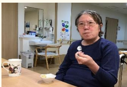
ネコのマグで、おやつタイム🐱