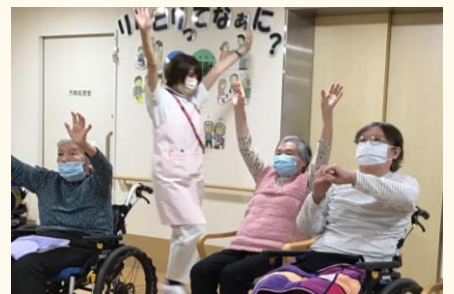
体操にも一生懸命です！！