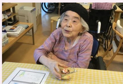
甘いものが大好きです。