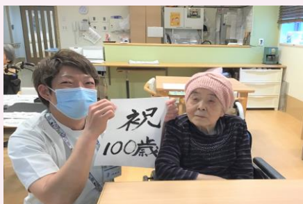
習字も頑張っています。