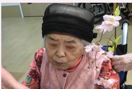
お花もよく似合います☆