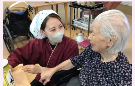
甘いものは大好きです！