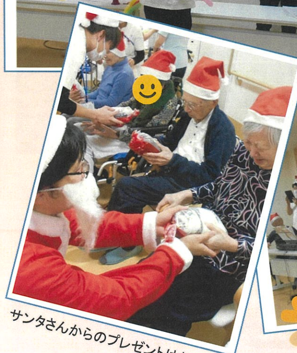
サンタさんからのプレゼントは何か？