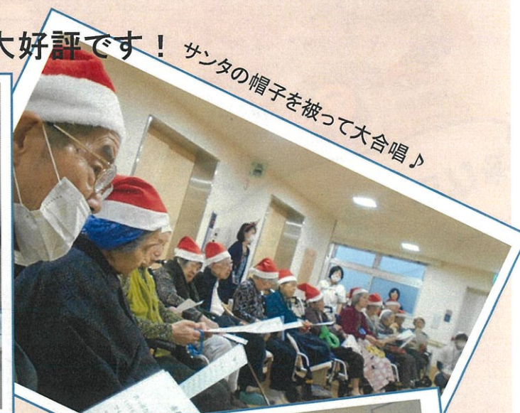
サンタの帽子を被って大合唱♪