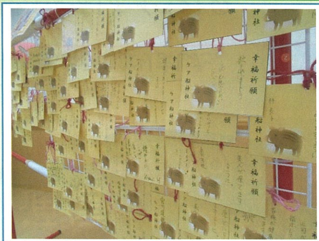
実際に飾られている絵馬の一部