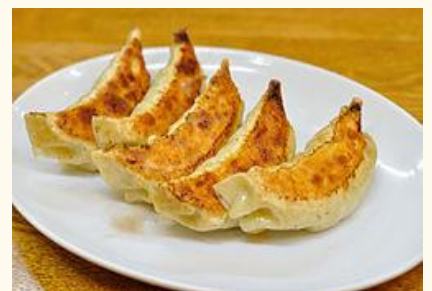
好きな食べ物は餃子！！ 白いご飯と一緒に体力回復！！