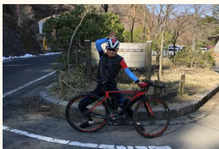
休日は趣味の自転車を満喫 しています！