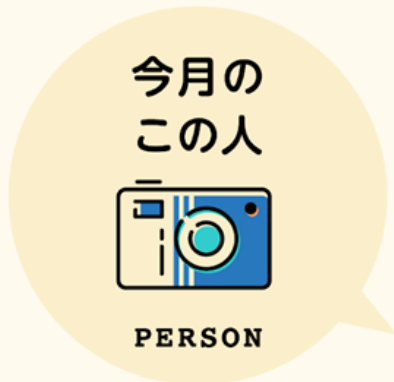
3階介護リーダー 高橋望 ●11月27日生まれ ●A型