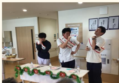
身体をはることも！(からし入り シュークリーム食べてます)