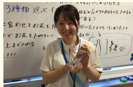
ハーバリウムの完成です