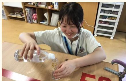
ボトルに花とオイルを入れて