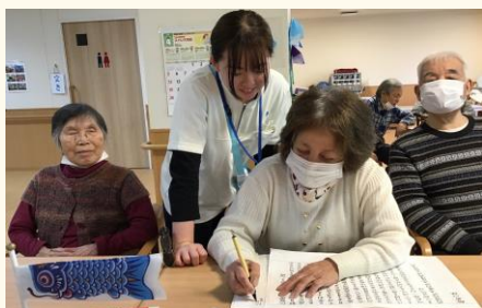
現在はデイサービスにて