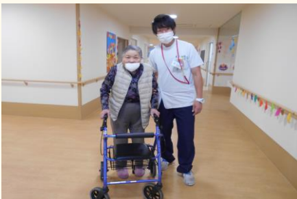
リハビリでは頑張って歩いています☆