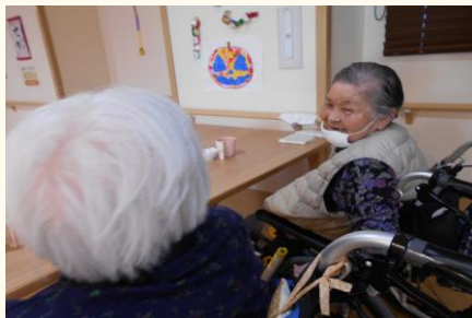
おしゃべりが大好き😊