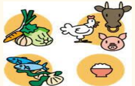
元気の秘結は何でも食べる事！！