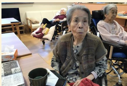
好き嫌いなく何でも食べます♪