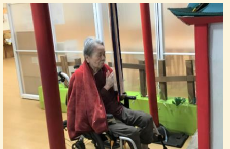
初詣は船ヶア神社で🍵