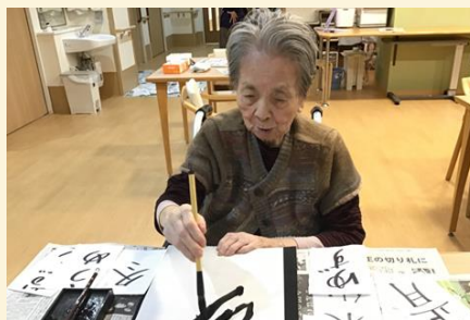
集中されています🍃